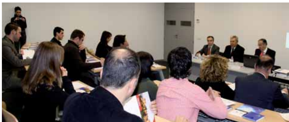
Un momento del acto celebrado en la Cámara de Comercio.

Pero el asesoramiento que HISPACOLEX-DEYCO presta a sus clientes en dichos países va más allá del mero asesoramiento jurídico y empresarial, pues también pueden solicitarse servicios de Oficina Comercial (Ferias; Jornadas, Misiones Comerciales, etc), estudios de mercado, búsqueda de socios locales, compra de Empresas, posibilidad inicial de fijar en dichos despachos el domicilio social, facilitación inicial de Director nativo (obligado en estos países) y ayuda en las relaciones con la Administración del país, disponiendo de un equipo que cuenta con un número importante de personal en sus dos sedes de Kiev y Moscú, 22 profesionales del derecho y la economía de dichos países que hablan perfectamente el español todos ellos, además de otros idiomas y de sus respectivas lenguas rusa y ucraniana. Independientemente de este personal que hay en sus sedes de Ucrania y Rusia, HISPACOLEX-DEYCO cuenta con dos kievitas y un moscovita que prestan sus servicios en la sede de Granada y Valencia, y a los que se puede acudir para preparar cualquier tipo de actuación en dichos países, así como para obtener información sobre las posibilidades de negocio en los mismos.