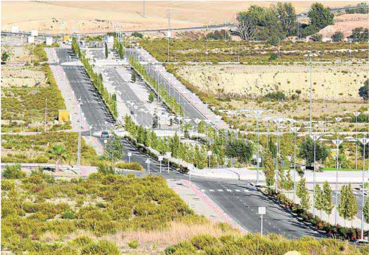
Polígono industrial. Vista general de los terrenos donde se hubieran instalado más de un centenar de empresas, en el término de Alhendín. :: ALFREDO AGUILAR