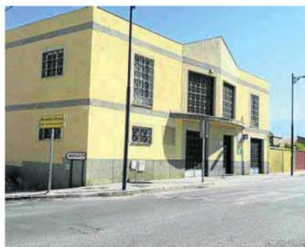
Las oficinas de la promotora, cerradas ayer a cal y canto.

A partir de ese año, la historia es la conocida. La urbanización de los solares siguió adelante conforme los problemas crecían para la promotora. Un momento clave en esta última fase del proyecto fue la asamblea celebrada por los empresarios vinculados al parque en marzo de 2011 y en la que se opusieron frontalmente a la aprobación del coste del mantenimiento del recinto hasta que los terrenos tuvieran el equipamiento comprometido. Fue el inicio del fin, por ahora, del polígono.