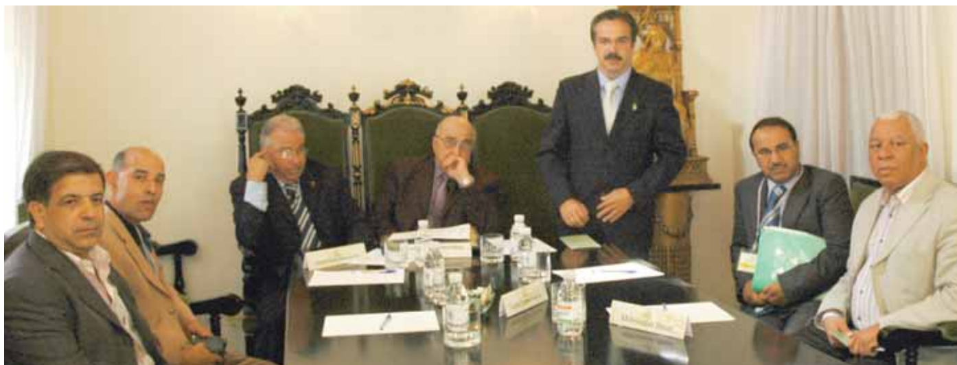
Un momento de la intervención del director de HispaColem en la reunión celebrada con distintos letrados de Marruecos.

Son muchas las empresas andaluzas que mantienen contactos comerciales con empresas marroquíes, por lo que se hacía necesario poner a disposición de nuestros clientes despachos colaboradores en Marruecos en los que apoyarnos para poder prestar una más completa asistencia jurídica en las relaciones comerciales y ante cualquier eventualidad jurídica que deba resolverse en dicho país.