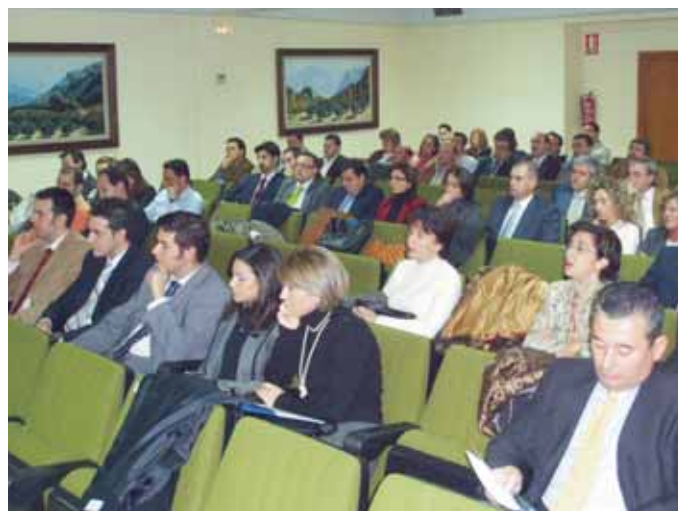
Público asistente a la Jornada.