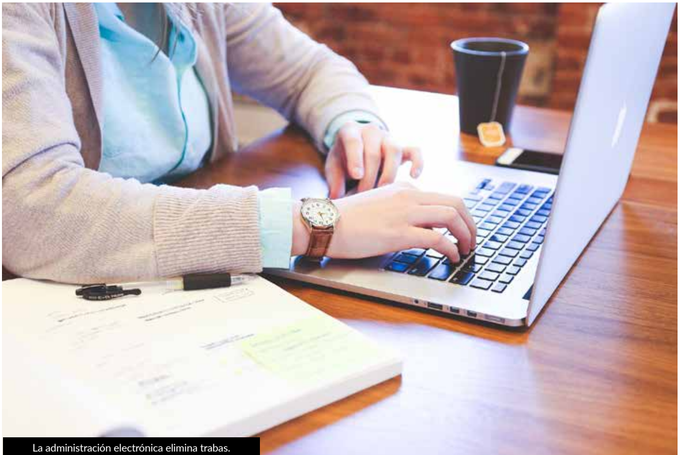
La administración electrónica elimina trabas.

En caso de incidencia técnica, se prevé que la Administración correspondiente pueda conceder una ampliación de los plazos no vencidos, hasta que ésta sea solucionada, debiendo publicar ambas circunstancias en la sede electrónica. Esta cuestión no resulta baladí, pues encontramos que sedes electrónicas de numerosas Administraciones Locales ni están operativas ni publican la existencia de incidencia técnica alguna, creando así una gran inseguridad jurídica pues, en caso de presentación presencial del escrito, se requerirá la subsanación mediante su presentación electrónica, considerándose como fecha de presentación la fecha en que haya tenido lugar la subsanación, por lo que ésta puede devenir extemporánea.