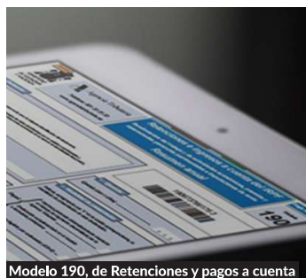
Modelo 190, de Retenciones y pagos a cuenta

Se acerca la próxima campaña de declaraciones informativas a presentar en la Agencia Tributaria a partir del 1 de enero de 2019, y como novedad técnica, se modifica el sistema actual que verificaba la información transmitida a posteriori una vez presentada, por el nuevo sistema on line, que supone no sólo la transmisión de la información, sino también la validación de la misma de forma simultánea y en tiempo real. De esta forma, los registros con errores, no serán admitidos por los sistemas de información de la AEAT en tiempo real, no como hasta ahora, que se aceptaban y si alguno presentaba error o inconsistencia se solicitaba posteriormente la rectificación o aclaración al contribuyente. Por lo que es recomendable que, para evitar problemas y errores en los registros a declarar, se acceda en caso de duda, al servicio de