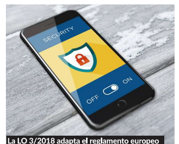
La LO 3/2018 adapta el reglamento europeo

La novedad más sonada de esta nueva ley la encontramos en la Disposición Final Tercera, la cual modifica la actual Ley Electoral habilitando a los partidos políticos a recabar datos personales, en el marco de sus actividades electorales, sobre opiniones de carácter político. Esta habilitación a los partidos políticos ha generado en la población española un malestar y una incertidumbre, obligando a la AEPD ha manifestar, el pasado 21 de