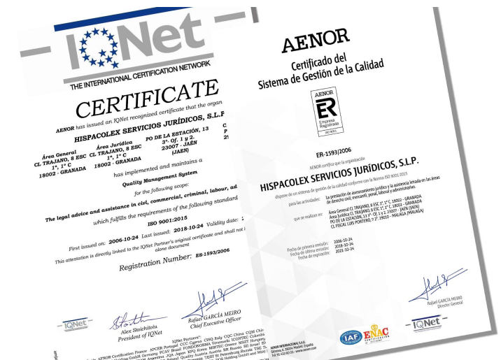
HispaColex ha renovado su sistema de calidad de conformidad con la norma ISO 9001:2015

Aportando soluciones realistas e integrales a los problemas y necesida-