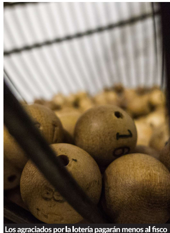
Los agraciados por la lotería pagarán menos al fisco

Si tu premio excede de estos límites exentos, tendrás que tributar por el 20% del importe del premio que exceda de la cuantía exenta. Si el premio fuera en especie, la base imponible es aquella cuantía que, una vez minorada en el importe del ingreso a cuenta, arroje la parte del valor de mercado del premio que