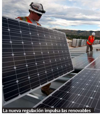
La nueva regulación impulsa las renovables

Pues bien, un acuerdo entre las tres instituciones pilares de la UE –el Parlamento de la UE, la Comisión y el Consejo– colocaba a mediados de junio de 2018 en el punto de mira el llamado impuesto al sol vigente en España