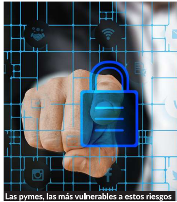
Las pymes, las más vulnerables a estos riesgos

Ahora ya lo conoce, su decisión pasará inexorablemente por autoasegurarse o transmitir las consecuencias de la citada contingencia que lleva toda la intención de convertirse en el principal riesgo sistémico al que estén expuestas las organizaciones... si no lo es ya.