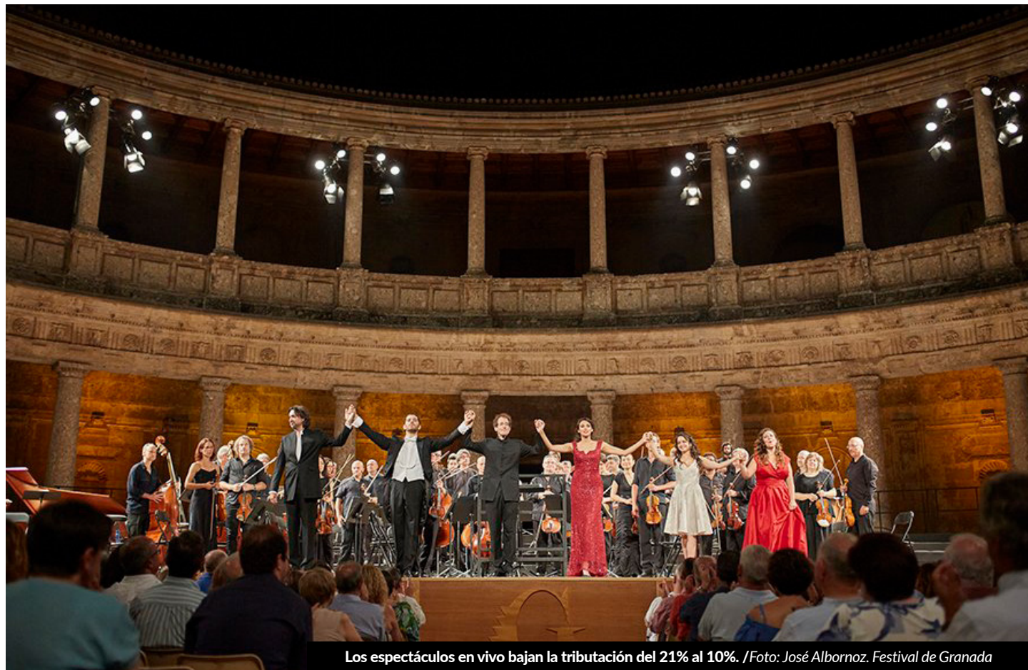
Los espectáculos en vivo bajan la tributación del 21% al 10%. /Foto: José Alborno. Festival de Granada

El porcentaje de deducción pasa del 15% al 20% para los productores registrados en el Registro de Empresas Cinematográficas que se encarguen de la ejecución de una producción extranjera. Igualmente, el límite individual máximo de gastos de personal creativo pasa a ser de 100.000 euros por persona.