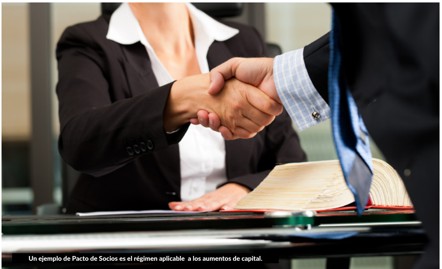
Un ejemplo de Pacto de Socios es el régimen aplicable a los aumentos de capital.

Además estos pactos que la Ley denomina “reservados” si se mantienen con este carácter, sin ser elevados a públicos –que no tiene por qué al no ser constitutivo de derechos– no serán oponibles a la