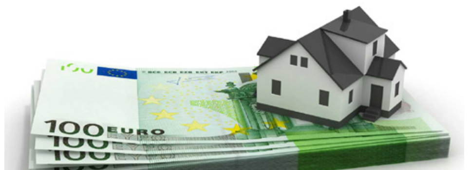
La mayoría de sentencias declaran abusivas las cláusulas de gastos

En definitiva y, en particular referido a esta última cuestión, es evidente que no existe al día de hoy suficiente seguridad jurídica al respecto y tendremos que esperar a ver cómo evolucionan los pronunciamientos de los Juzgados de Primera Instancia y de las distintas Audiencias Provinciales para encontrar una solución uniforme que podría culminar con un nuevo pronunciamiento del Tribunal Supremo.