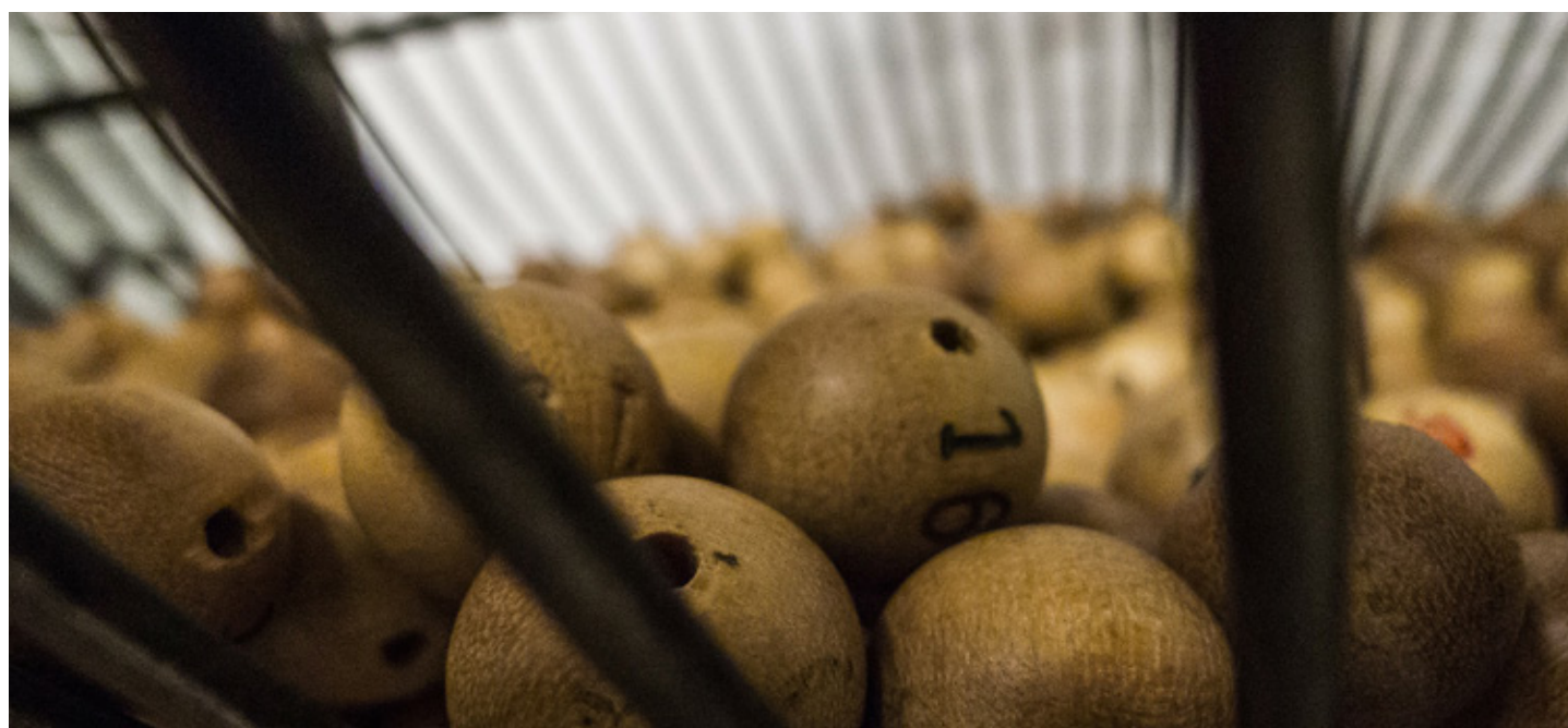
Los agraciados por la lotería pagarán menos al fisco

Cuando el régimen matrimonial es el régimen de gananciales, está resuelta en el Código Civil, el artículo 1.951 estipula: "Las ganancias obtenidas por cualquiera de los cónyuges en el juego o las procedentes de otras causas que eximan de la restitución pertenecerán a la sociedad de gananciales". Por lo tanto, el premio pertenecerá en común al matrimonio con independencia de quién y cómo haya comprado el décimo.