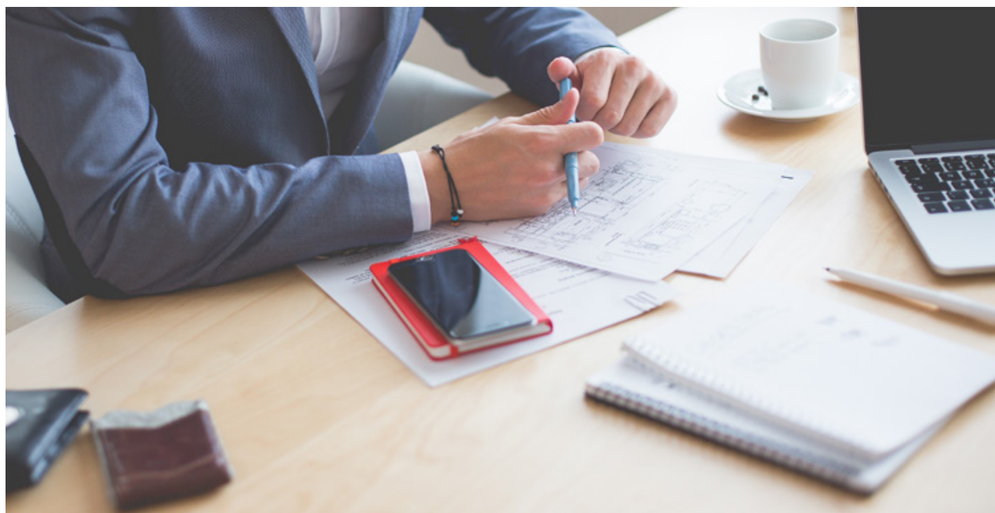
Modelo 190, de retenciones y pagos a cuenta

Por último, recordar que para este ejercicio, las plataformas de alquiler de viviendas para uso turístico, del tipo airbnb o wimdu, tendrán que declarar por primera vez, los datos de los arrendadores, por tanto es una nueva herramienta de control del alquiler vacacional a tener en cuenta.