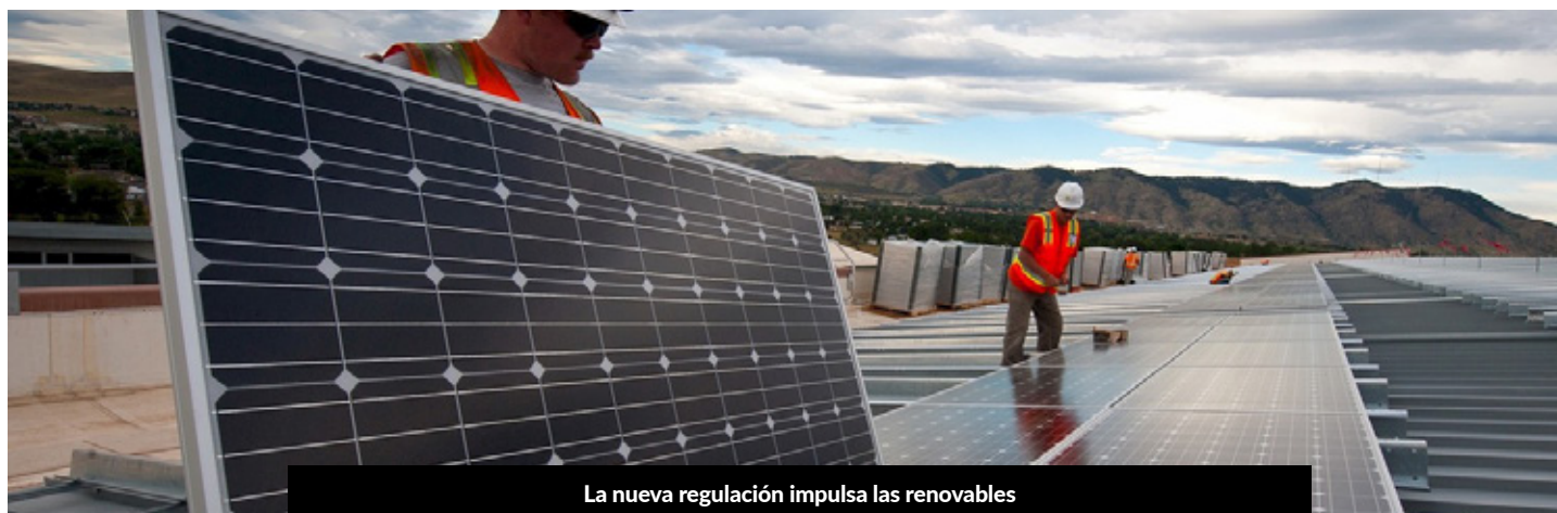
La nueva regulación impulsa las renovables

En definitiva, esta nueva regulación y medidas legales supone una apuesta por el sector fotovoltaico y las energías renovables, así como un impulso al autoconsumo eléctrico en España en un entorno de libre mercado y sin barreras.