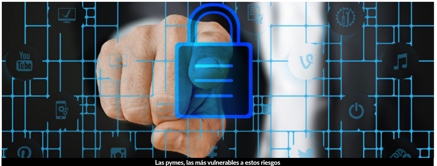
Las pymes, las más vulnerables a estos riesgos

Ahora ya lo conoce, su decisión pasará inexorablemente por autoasegurarse o transmitir las consecuencias de la citada contingencia que lleva toda la intención de convertirse en el principal riesgo sistémico al que estén expuestas las organizaciones ... si no lo es ya.