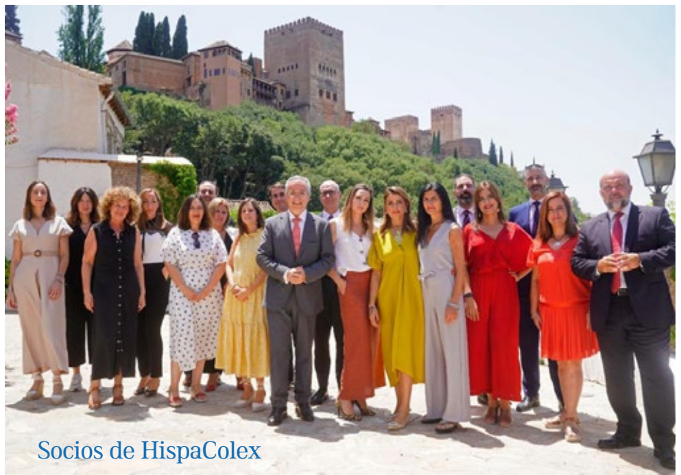
Socios de HispaColex