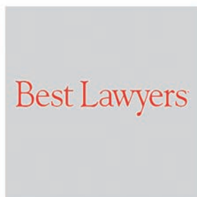
Ignacio Valenzuela Cano. Best Lawyer 2023 en el área de litigación mercantil (LITIGATION)